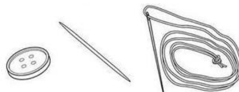
Button • Toothpick • Needle with 24 inches of thread